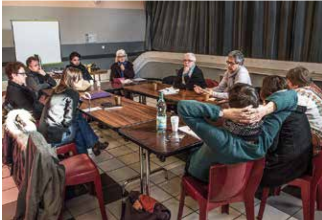
Table ronde : Réaliser un 2 e documentaire

Après le succès de l'an passé, ChrOma reconduit la tenue d'une table ronde dédiée à la production d'un second film documentaire. Elle réunira les réalisateurs sélectionnés au concours Premier Doc, des producteurs, des réalisateurs dont certains ont participé les années précédentes à ce concours.